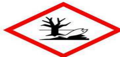
Danger pour le milieu aquatique